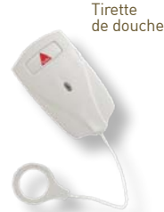
Tirette de douche